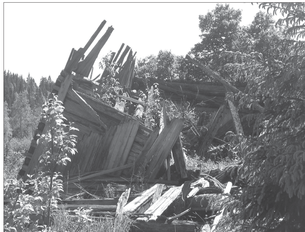
Den övergivna byn Igelhøjden i Gåsborn.

Nästa FINNSAM-info kommer i september. Manusstopp 1 sep.