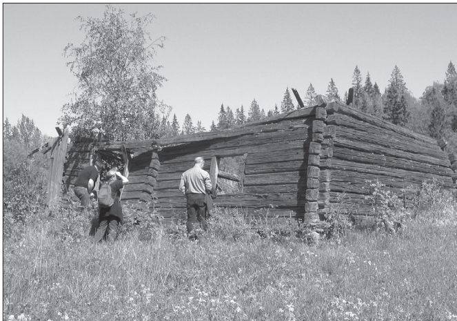
En av ruinerna i Igelhöjden.