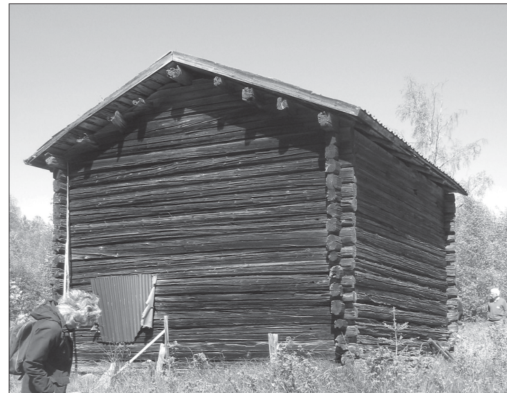
Rian i Skäfthöjden.

30/6 och 1/7 18.00 Kollsberg, teater: "Än susar skogen" av Gunilla Rubbestad, drama om och med färgstarka kvinnor på Finnskogen från förr